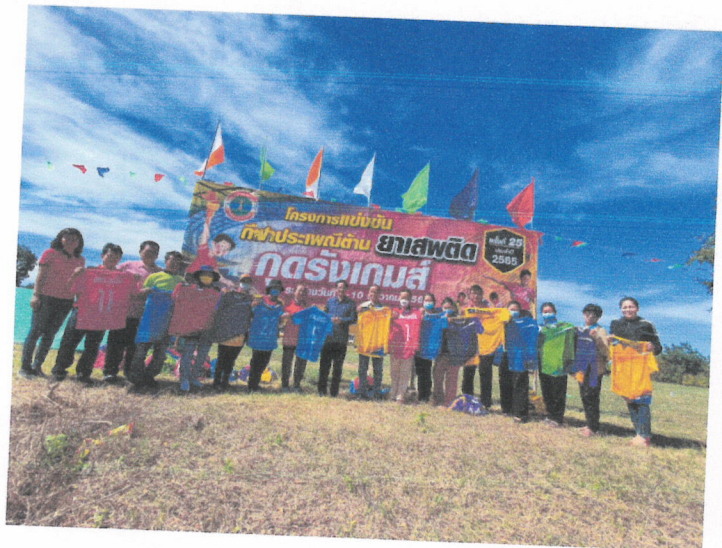
สนามกีฬา ที่ทำการองค์การบริหารส่วนตำบลฤๅง หมู่ที่ ๑-๑๖