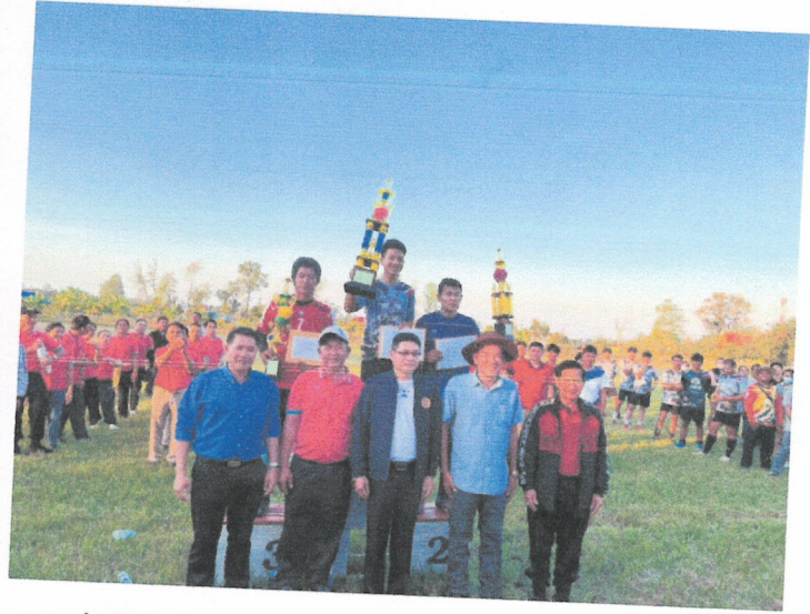
สนามกีฬา ช่างวัดบ้านโคกสี หมู่ที่ ๕