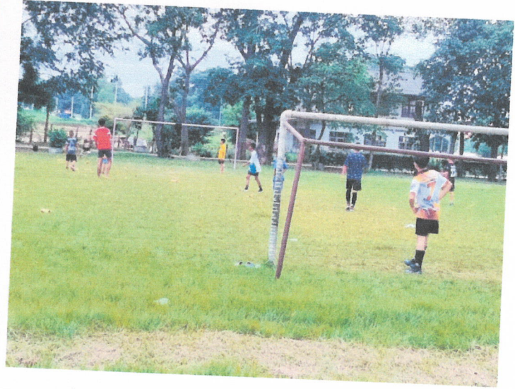
สนามกีฬา บ้านหัวช้าง หมู่ที่ ๑๔