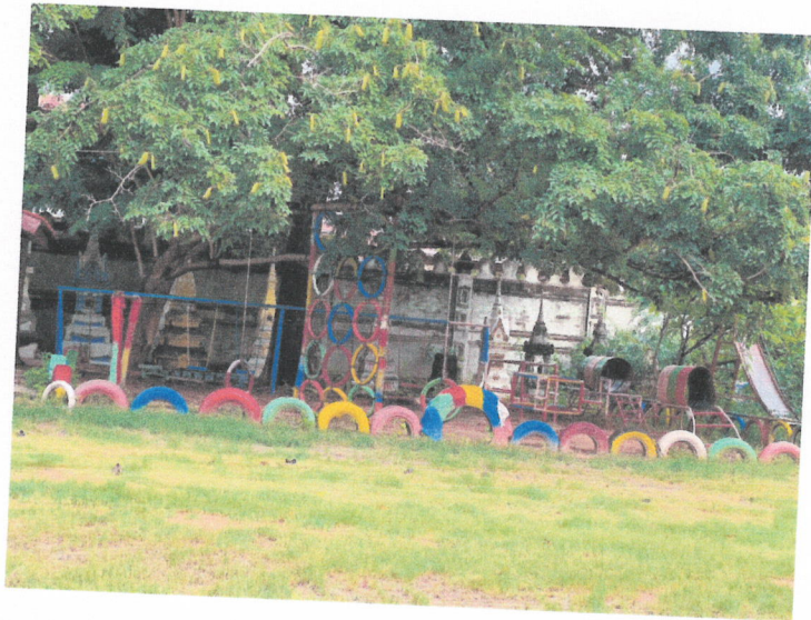
ลานกีฬา ณ ฟ้าสำนักงานส่งเสริมการศึกษานอกระบบและการศึกษาตามอัธยาศัย (กศน.เก่า) หมู่ที่ ๑