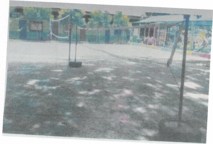
สนามกีฬา ที่ทำการองค์การบริหารส่วนตำบลกุดรัง หมู่ที่ ๓