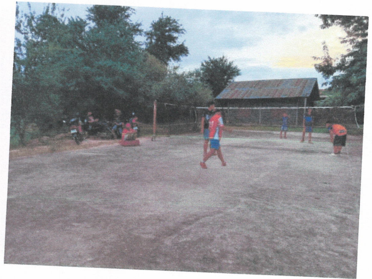
สนามกีฬา บ้านดอนโมง ณ โรงเรียนภูตรังประชาสรรค์ หมู่ที่ ๗