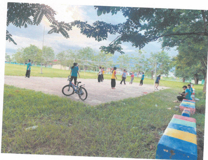
สนามกีฬา บ้านหนองคลอง หัวข้าว ศรีวิไล หมู่ที่ ๖,๙,๑๓