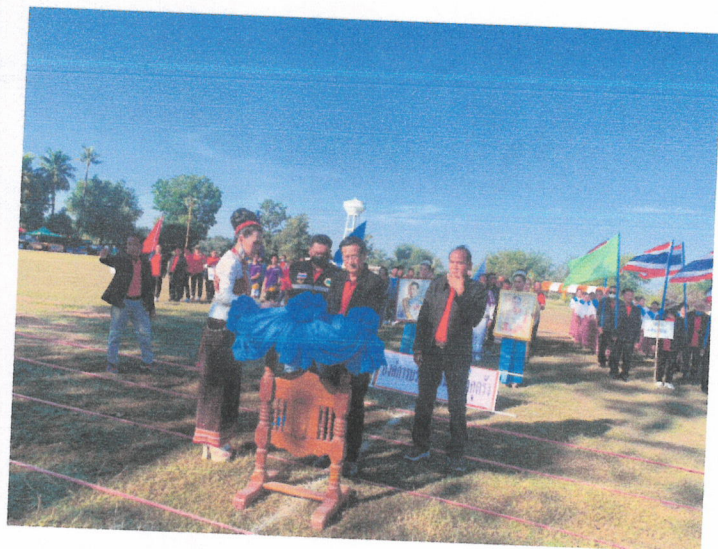
ลานกีฬา/สนามกีฬา บ้านหัวช้าง สว่าง หมู่ที่ ๔,๑๑