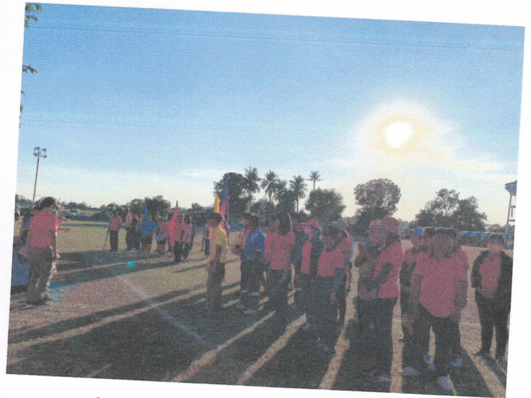
ลานกีฬา รอบสระบ้านหนองบัว หมู่ที่ ๒,๑๕