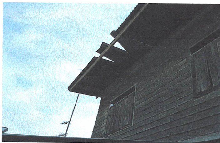
กันหา กางเกต