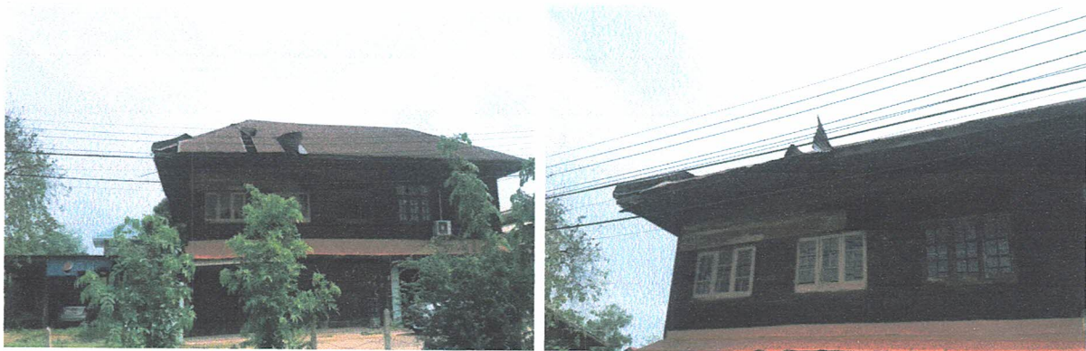
บ้านนายจำปี บุรินอก