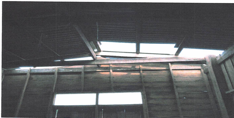
สวีสต์ดี มาลาหอม